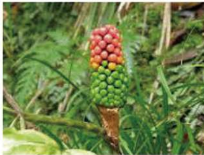
秋に実がついた時